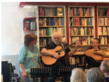
Am Kursabend liest die Herausgeberin ausgewählte Passagen des Romans und lädt die Teilnehmenden zum Diskurs ein.

Lesung und Diskurs. Der historisch-kritische Roman „Hecht in Himmerod“ (1990) von Albert Pütz (1932-2008) erschien im April 2024 in vollständig überarbeiteter Neuauflage als Taschenbuch im Eifeler Literaturverlag. Ausgangspunkt der fiktionalen Handlung ist die Geheimtagung ehemaliger Wehrmachtsoffiziere in der Abtei Himmerod im Oktober 1950 zur Vorbereitung der Wiederbewaffnung Westdeutschlands. Der Autor nimmt die historische Begebenheit zum Anlass, Ereignisse, Handlungsverläufe, Landschaften und Schicksale zu einem dichten Geflecht zu verweben, Zeitsprünge und regionale Kuriositäten inklusive. Aus dem, was er 1945, 1950, 1990 in Himmerod, Trier und Wittlich geschehen lässt, entsteht ein Kaleidoskop des Widerstands: persönlich, politisch, menschlich. Ein spannungsgeladener Text, surreal und verblüffend nah am Geschehen heutiger Zeiten, in denen eine Kriegsertüchtigung der Zivilgesellschaft auf der politischen Agenda steht. Geschichte wiederholt sich nicht, jedenfalls nicht linear. Doch zeigt der Blick zurück was möglich ist – im Guten wie im Bösen.